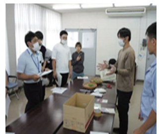
「京おくら」農家等との業務請負に係るマッチング会の様子