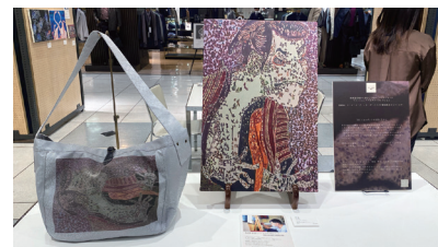
障害のある作家の絵を西陣織のバッグに転写しイベントで展示

伝統産業分野における障害のある方の職域を拡大し、就労支援・雇用創出を図ることで、技術継承や後継者確保を目指すため、障害のある方の雇用又は市内の福祉施設への業務の発注に意欲がある伝統産業事業者等に対して、専門家の派遣や障害のある方を雇用する際に必要な備品購入等に要する費用の補助を行っています。