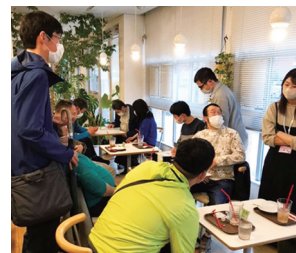
交流サロン「ぼろぼろ」

障害のある方の長期就労を支援することを目的に、「京都市障害者職場定着支援等推進センター」（北山ふれあいセンター内）及び本センターの南部分室（京都テルサ内）を設置し、両センターに配置している専門職員が、就労に関する相談、企業訪問等による状況把握、仲間づくり支援（交流サロン）などを行い、障害のある方の自立と社会参加を推進しています。