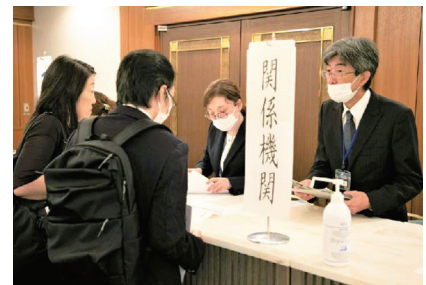
イベント会場での受付対応の様子