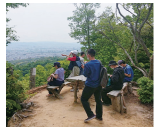
お出かけセミナー（野鳥遊園）