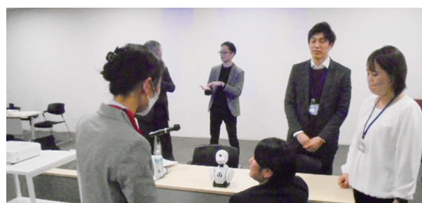
就労支援推進会議の様子（左：京都市からの事業報告 / 右：（株）オリイ研究所講演後の意見交換）