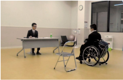
【利用者向け】障害者就労支援スキルアップ研修会 「企業で模擬面接を体験しよう！」

2名の「障害者就労支援プロモーター」を配置し、福祉施設職員の支援スキルや障害のある方の就労スキルを高める研修をはじめ、地域企業の人事担当者等を対象とした研修やセミナー、障害者雇用等の検討を進める地域企業の課題に応じた専門家派遣を実施し、障害のある方の雇用の拡大等を目指しています。