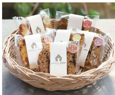
取扱製品の一部（左：ピアス・イヤリング / 右：ビスコッティ）