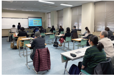
【企業向け】障害者雇用セミナー 「障害のある方の多様な働き方セミナー～デジタル技術の発展による新たな職域拡大の可能性～」