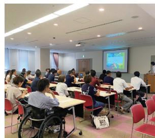
農福連携に意欲のある農家等と福祉施設の合同マッチング会の様子

具体的には、農福連携を希望する福祉施設の開拓及び農家とのマッチングに取り組むことで、農家から福祉施設への委託業務の抽出・新商品の開発等に取り組めます。