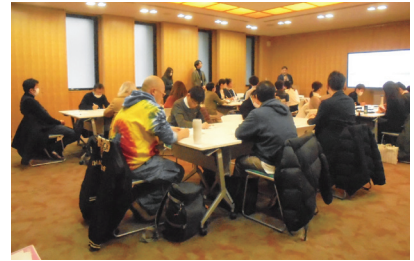
【支援者向け】障害者就労支援スキルアップ研修会 「就労支援事業所管理者向け研修会」